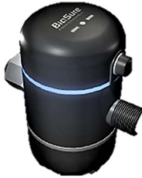
EOS 7175 – P 700 – 1800 lbs x día (nominales)