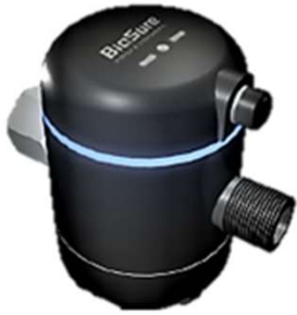
EOS 7175 – S Hasta 1,000 lbs x día (nominales)